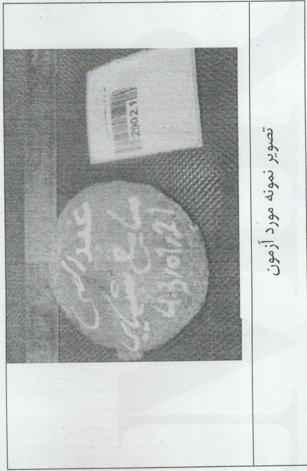
تصویر نمونه مورد آزمون

گزارش تنها با برچسب هولوغرام، کاغذ برجسته و مهر مورد تایید است. نمونه داری و تطابق نام نمونه با قطعه ارسالی در حیطه مسئولیت این مرکز نیست. باقیمانده نمونه های مورد آزمون حداکثر به مدت یک ماه نگهداری خواهد شد. نمونه گیری توسط مشتری انجام گرفته است. نتایج فوق تنها برای نمونه های مورد آزمون قابل استناد است. همه اطلاعات مربوط به نتایج آزمون ها، محرمانه تلقی می شود و جز با اجازه مشتری یا به واسطه الزامات قانونی قابل ارائه به غیر نیست. در صورت وجود هرگونه ابهام، مراتب را به صورت مکتوب به مدیر آزمایشگاه اعلام فرمایید. صدای مشتری: ۴۶۸۳۱۵۶۸ (۰۲۱) دفتر مدیر عامل: ۴۶۸۱۵۵۳۳ (۰۲۱) نشانی: تهران، کیلومتر ۲۱ جاده مخصوص کرج، ورودی شهر قدس، بلوار حاج قاسم اصغری، خیابان فرزان، پلاک ۸. کدپستی: ۳۷۵۳۱۴۶۱۷۱ Email: info@razi-center.net Website: www.razi-center.net تلگرام/واتس اپ/ایتا: ۰۹۱۳۷۹۹۰۸۷۰ تلفن: ۰۶۳۰۷ و ۰۶۶۸۴۳۳۷۱ (۰۲۱) دورنگار: ۴۶۸۳۱۵۷۰-۷ و ۴۶۸۳۱۵۹۷ (۰۲۱)